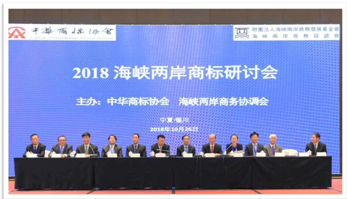
第 13 屆“2018 海峽兩岸商標論壇”開幕式

10月26日，由中華商標協會，海峽兩岸商務協調會共同主辦的第13屆“2018海峽兩岸商標論壇”在寧夏回族自治區銀川市成功舉辦。國家知識產權局副局長廖濤以中華商標協會顧問身份與海峽兩岸商務協調會名譽會長、國民黨榮譽副主席林豐正，寧夏回族自治區人民政府副主席王和山，中華商標協會會長兼秘書長馬夫，海峽兩岸商務協調會副會長王桂良等嘉賓出席論壇並致辭。國家知識產權局港澳台辦公室副主任原琪以中華商標協會常務理事身份主持會議開幕式。國家知識產權局商標局副局長崔守東，商標評審委員會主任趙剛，辦公室副主任劉超，商標審查協作中心副主任張國鵬，海峽兩岸商務協調會副會長兼秘書長黃旭昇，寧夏回族自治區市場監督管理廳廳長羅萬里等嘉賓出席論壇開幕式。