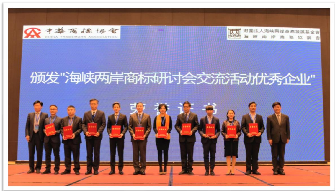
“海峽兩岸商標論壇交流活動優秀企業”榮譽證書授證III