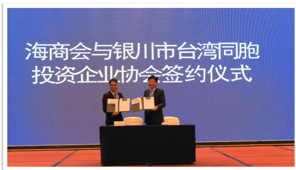
海商會與银川市台灣同胞投資企業協會簽訂合作協定