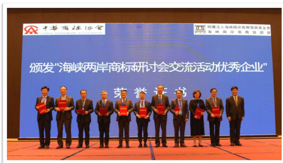
“海峽兩岸商標論壇交流活動優秀企業”榮譽證書授證 I