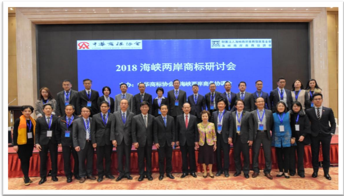
第 13 屆海峽兩岸商標論壇圓滿閉幕兩岸與會嘉賓合影