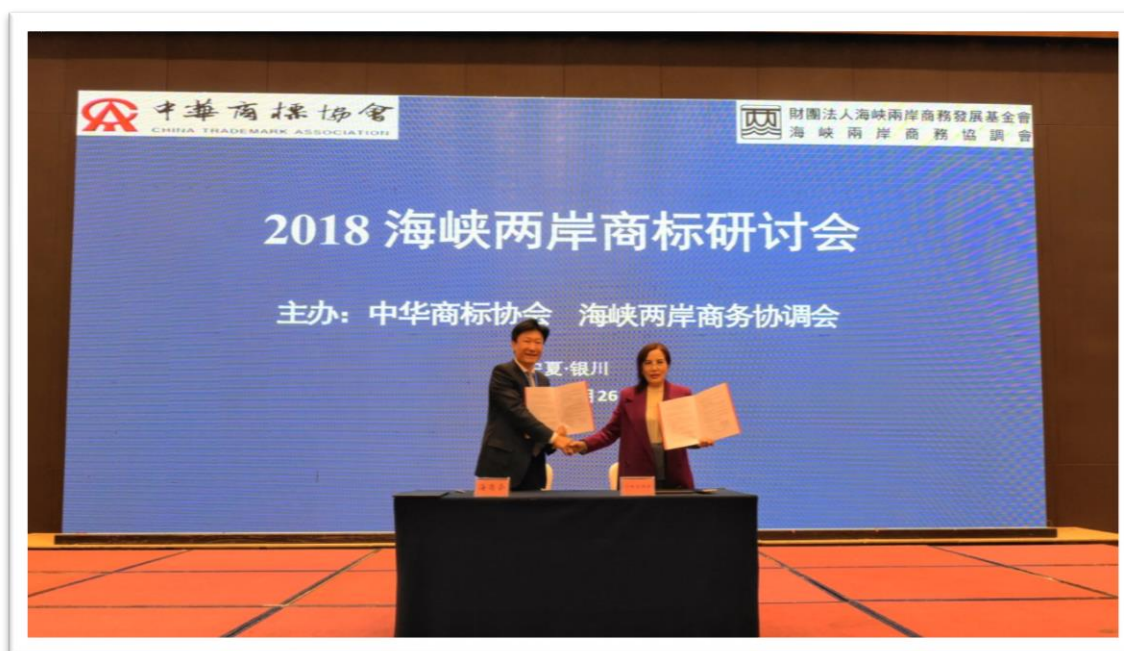
海商會與寧夏回族自治區私營企業協會簽訂合作協定

此外，本次論壇的一大亮點，是在會議上頒發了“海峽兩岸商標論壇交流活動優秀企業”榮譽證書。中華商標協會和海峽兩岸商務協調會為表揚12年來支持海峽兩岸商標論壇活動，並促進兩岸商標品牌合作交流作出傑出貢獻者，特於此次論壇中首次頒發海峽兩岸商標論壇交流活動優秀企業榮譽證書。該授證舉行，除表達主辦單位對獲證企業長期對兩岸商標品牌合作交流的貢獻