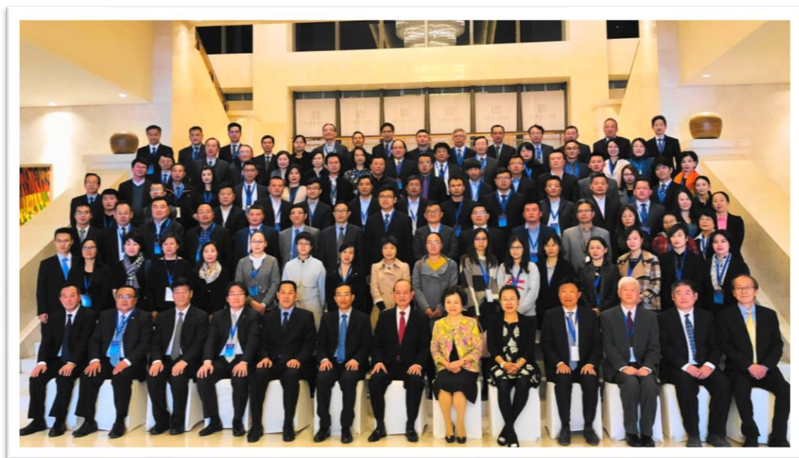
第 13 屆海峽兩岸商標論壇與會代表合影

堤維西交通工業股份有限公司 克麗緹娜集團 慈濟慈善事業基金會 嶢陽茶行貿易有限公司 新東陽股份有限公司 龍口食品股份有限公司 廣流智權事務所 魯能集團 北京天誠聯合知識產權代理有限公司 北京科亮知識產權代理有限公司