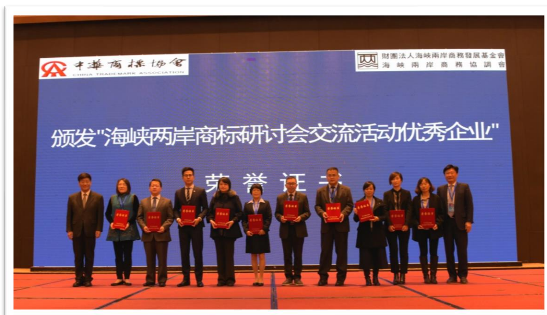
“海峽兩岸商標論壇交流活動優秀企業”榮譽證書授證 II